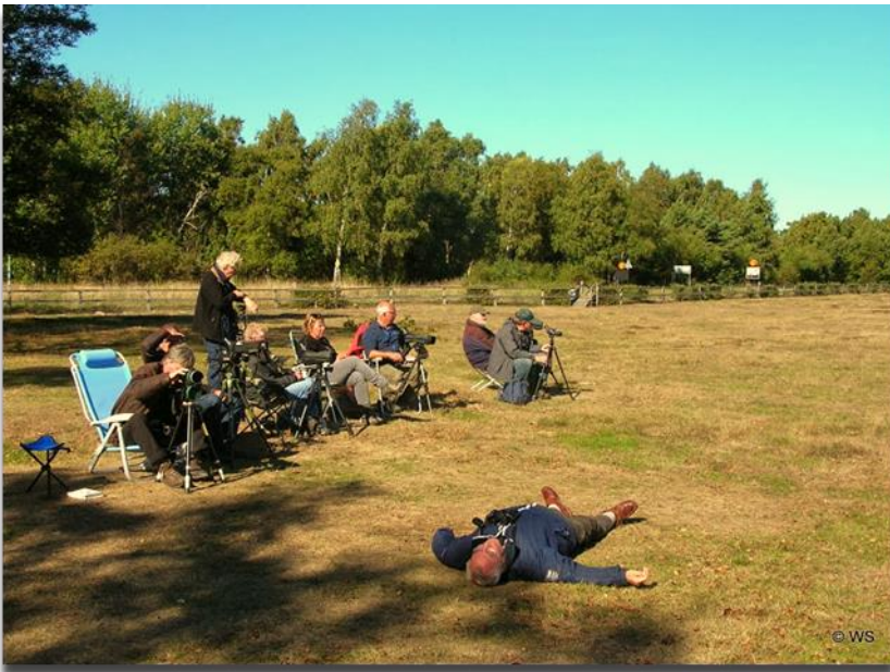
Op de heide

taart deze Oehoe. De zogenaamde ervaren vogelaars zullen nu wel meer feitelijke informatie willen hebben van wat we gezien hebben. Zoals gezegd, er was bitter weinig te zien. Zowel in aantallen als in soorten. Relatief veel Kruisbekken en ook die ene met de witte band. Kleine groep Kraanvogels die 's avonds over kwamen vliegen. Buizerds en Ruigpootbuizerds, soms moeilijk vast te stellen welke. De Sperwer en het Smelleken. Op andere plaatsen Rode Wouwen, de Steenarend en een aantal Raven. Dat was weer in Fyledalen. Mooi was de Slechtvalk ondanks dat hij voornamelijk zijn rug liet zien. Toch was daar ook de Bruine Kiekendief. Opmerkelijk waren de grote groepen Brandganzen. Onverwacht op dit moment.